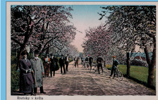
Roztoky v květu

Roztokám náleží titul nejstaršího vilového letoviska v okolí Prahy. Rozhodujícím podnětem pro rozvoj území bylo zprovoznění Severní státní dráhy Praha–Dražďany v roce 1851. Železnice zásadně změnila život do té doby poklidného venkova. Nevelká obec na levém břehu Vltavy, s táhlou roztroušenou vesnickou zástavbou a přirozenou dominantou panského zámku, se stala vyhledávaným výletním místem. K návštěvám lákala rozmanitá krajina s řekou, strmými svahy a háji, loukami, ovocnými sady a vinicemi. Hlavní proud nové výstavby se koncentroval stranou od jádra vesnické zástavby v údolí Únětického potoka, které bylo od konce 19. století nazýváno Tichým údolím. Majitelé letních vil patřili mezi vyšší střední třídu, byli to především pražští obchodníci a továrníci židovského původu, z nichž většina nepřežila holocaust. První dodnes dochovaná letní vila Mia byla postavena v polovině 19. století. Největší rozkvět letovisko prožívalo v poslední třetině 19. století.