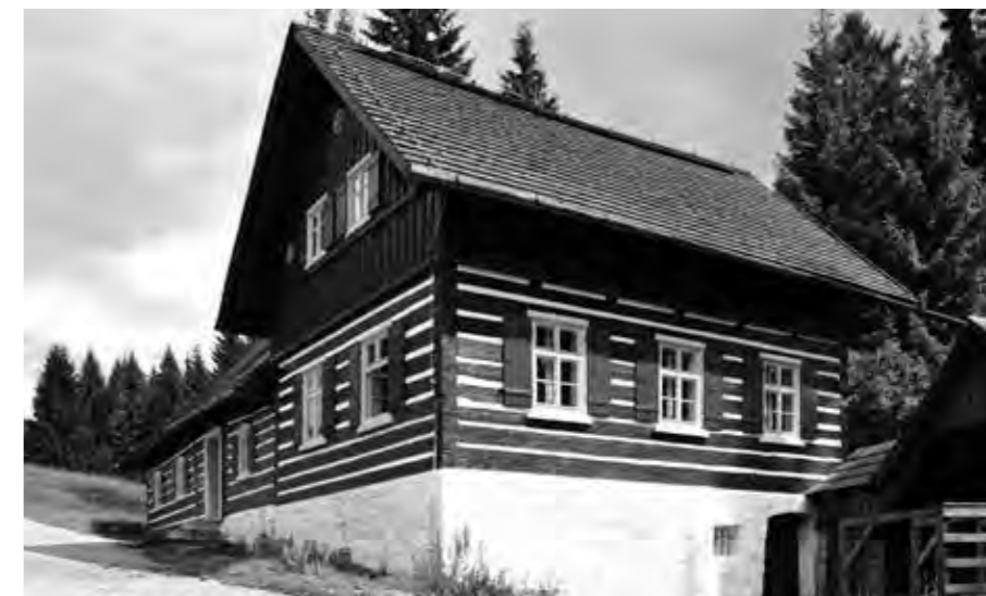
TAKZVANÁ LIŠČÍ BOUDA PŘEDSTAVUJE POSLEDNÍ DOCHOVANÝ DŮM JIŽ NEEKZISTUJÍCÍ SKLÁŘSKÉ OSADY KRISTIÁNOV.