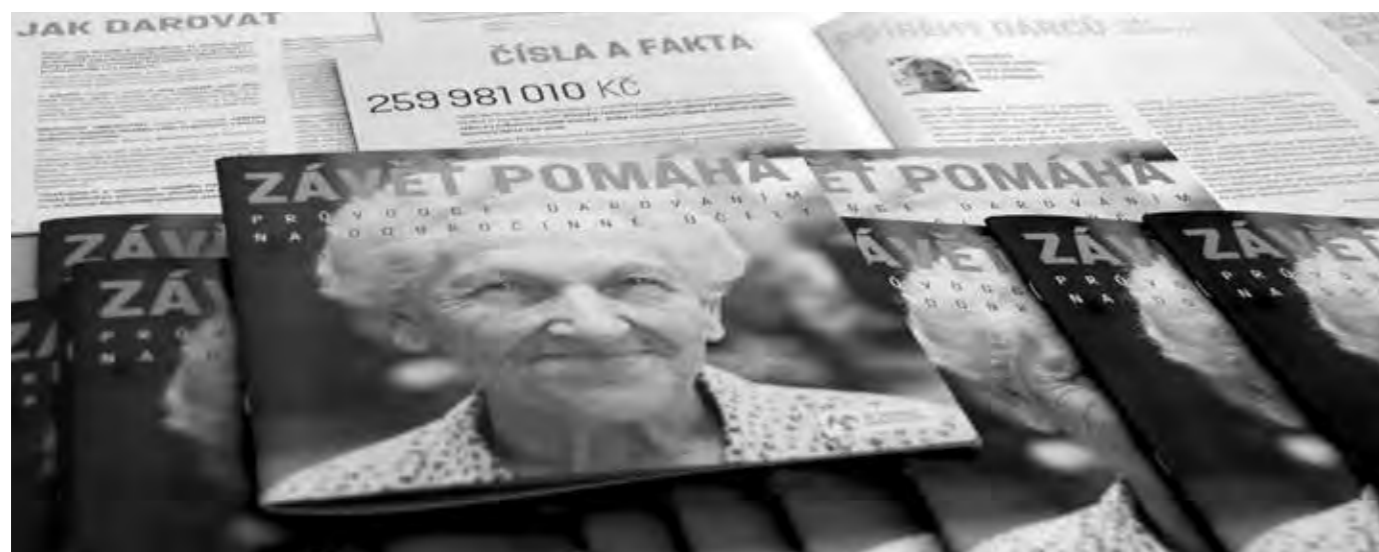
KOALICE ZA SNADNÉ DÁRCOVSTVÍ VYDALA V ZÁŘÍ 2017 INFORMAČNÍ BROŽURU V RÁMCI KAMPANĚ ZÁVĚT POMÁHÁ.