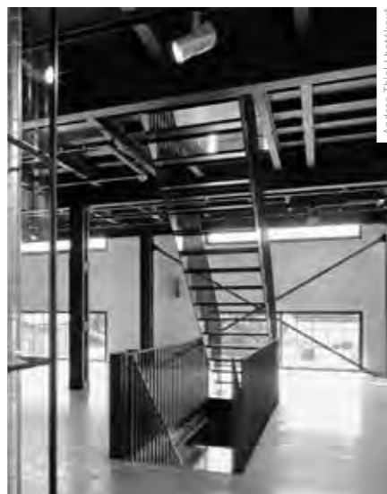
Andrea Thiel, Lhotáková

Myslím, že pozitivní příklady táhnou a je to i vidět. Co mne trápí možná více, je náš vztah k prostředí, kde žijeme, k domům, které obýváme, k stavbám, které užíváme, k ulicím, kterými se přesouváme. Stále nechápu, co je za těmi necitlivými přestavbami domů všude kolem nás, těmi neuvěřitelně kreativními ploty, kterými si z jedné strany vytváříme intimitu domova a přitom z druhé strany podporujeme asociálnost veřejného prostranství.