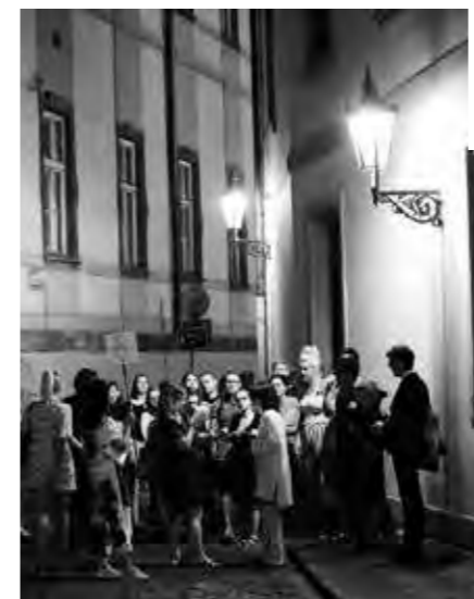
PŘI KOMENTOVANÉ PROCHÁZCE NOČNÍ PRAHOU AUTORKA HOVOŘILA NEJEN O PLYNOVÝCH LAMPÁCH.