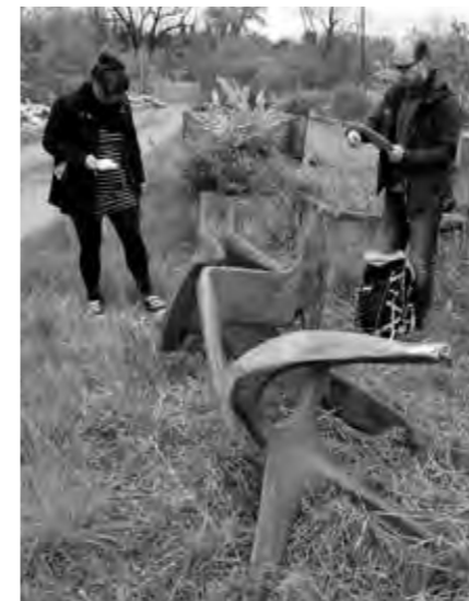
LAMINÁTOVÉ SOUSOŠÍ RACCI DEPONOVANÉ VE SBĚRNÉM DVOŘE V PLZNI