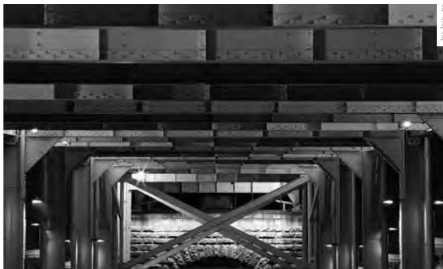
Z ULICE POD MOSTEM SECOND STREET BRIDGE VE MĚSTĚ LOUISVILLE VZNIKLA PĚŠÍ A ODPOČINKOVÁ ZÓNA. LENI SCHWENDINGER VYTVOŘILA OSVĚTLENÍ CELÉHO PROSTORU VČETNĚ KOVOVÉ MOSTNÍ KONSTRUKCE.