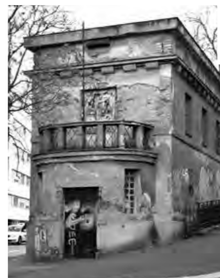
NA SMÍCHOVĚ SE ZATÍM HLEDÁ NÁVRH NA REHABILITACI TRAFOSTANICE A JEJÍHO OKOLÍ.

Těch možností je více a stále je hledáme a zkoušíme. V každém případě počítáme se zachováním trafostanice. Nyní pracujeme na přípravě území – podařilo se nám domluvit a přesunout břímě nechtěného siamského dvojčete v podobě novodobé trafostanice, která byla necitlivě umístěná hned vedle té naší. Podařilo se dořešit majetkoprávní vztahy tak, abychom mohli řešit území komplexně. V roce 1989 byl zbořen secesní „palác“ s tržnicí a lázněmi, do kterých chodil i pan Škvorecký. Na jeho místě byla v 90. letech vybudována transformační stanice TR110/22kV Smíchov pro uskutečnění nastupujícího stavebního boomu (zprovozněna byla v roce 2000). Tento objekt svojí velikostí a povahou funkce celý původně městský prostor fatálně oslabil a degradoval, a tak místo získalo spíše