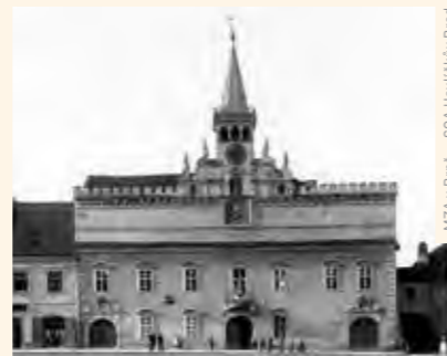
MZA v Brně – SOA Havlíčkův Brod

Zajímá vás současná obnova a možnosti využívání radnic? Zúčastněte se konference PROPAMÁTKY. Její jubilejní 10. ročník se uskuteční 9.–10. listopadu ve Staré radnici v Havlíčkově Brodě. Zazní přednášky o architektuře i historii radničních budov nebo o pohledu památkové péče. Představeny budou i zdařilé rekonstrukce, adaptace, ale i nová netradiční využití na