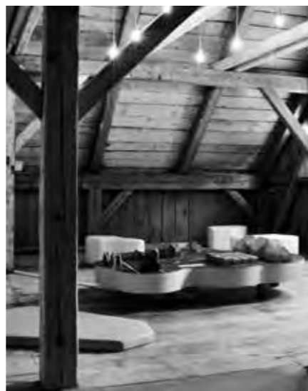
PODKROVNÍ ODPOČINKOVÝ KOUTEK PRO DĚTI SE SKLÁDAČKOU MODELU PŮVODNÍ OSADY

Texty k exponátům vytvořil Petr Nový a grafické řešení panelů provedl David Matura. Ústředním prvkem výstavního prostoru je trojrozměrný kompletně renovovaný model osady Kristiánov v době největšího rozkvětu. Vizually poutavý model vytvořil jablonecký rodák František Ulbrich a v rámci současné expozice je prezentován na novém odlehčeném podstavci, který lépe odolává místním tepelným výkyvům. Na doprovodných panelech jsou