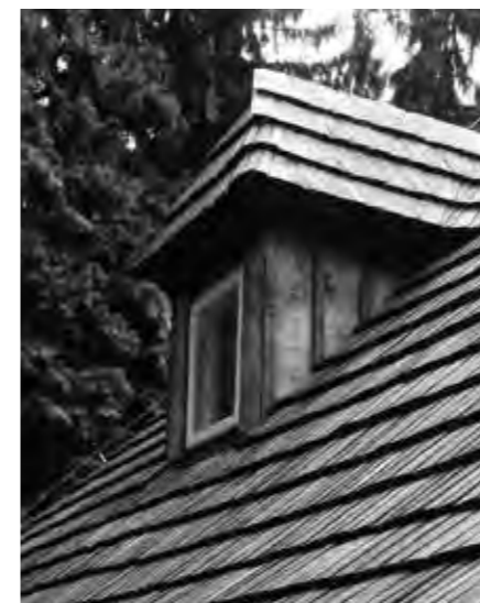
OBNOVENÝ VIKÝŘ S DETAIEM STŘECHY ZE SMRKOVÉHO ŠTÍPANÉHO ŠINDELE