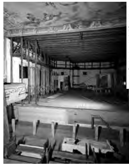
OBNOVA JEVIŠTNÍHO VYBAVENÍ ČESKOKRUMLOVSKÉHO BAROKNÍHO DIVADLA V 90. LETECH

TEXT DAGMAR KOŽELUHOVÁ