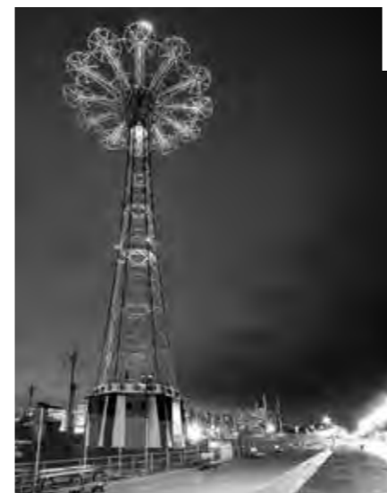
AUTORKA NAVRHLA OSVĚTLENÍ POUŤOVÉ ATRAKCE Z ROKU 1939. PARACHUTE JUMP V NEW YORKU