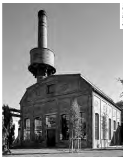
CIHLOVÝ KOMÍN S FUNKČNÍM VODOJEMEM JE SYMBOLEM LOKALITY A HISTORICKOU STOPOU MÍSTA.

jsou symbolem naší lokality a historickou stopou místa. Starší cihlový komín stále částečně slouží svému účelu. Nachází se na něm funkční vodojem. Ale jinak se z něj již nekouří. Díky rekonstrukci se naskytla unikátní příležitost nahlédnout do komínu zevnitř. Co se týká železobetonového komínu typu Tomáš, tak ten také zachováme. Zatím hledáme to správné využití. On je dost úzký na to, jak je vysoký. Třeba se z něho stane nový výtvarný symbol Libčic.