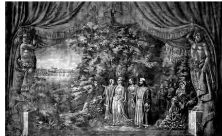
OPONA STARÉHO MĚSTSKÉHO DIVADLA V CHRUDIMI JE PO RESTAUROVÁNÍ VYSTAVENA V DIVADLE KARLA PIPPICHA.