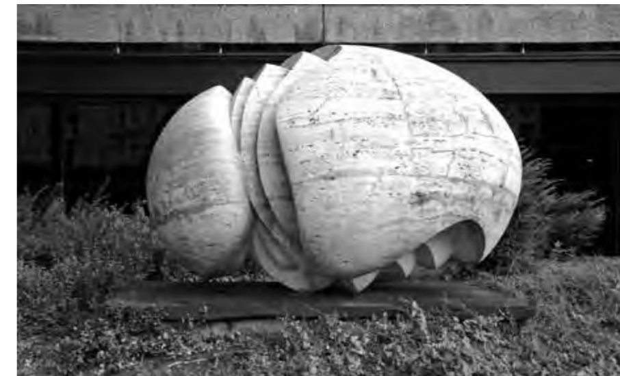
ABSTRAKTNÍ SOCHA SLAVOJE NEJDLA PŘED HOTELEM THERMAL V KARLOVÝCH VARECH