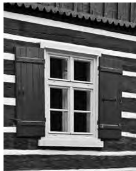
REPASOVANÉ OKENNÍ VÝPLNĚ