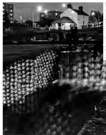
SVĚTELNÁ INSTALACE VODA NAD VODOU OSVLAVILA SKOTSKOU PAMÁTKU FORTH AND CLYDE CANAL.