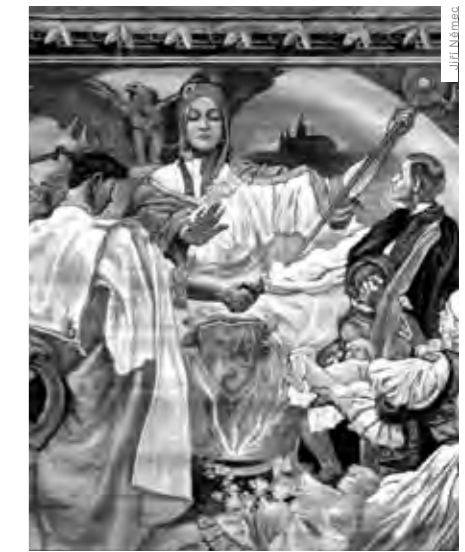
DETAIL OPONY VYTVOŘENÉ VE 20. LETECH 20. STOLETÍ PRO ČTENÁŘSKO-OCHOTNICKÝ SPOLEK V ÚSOBÍ

To podstatné však tkví v tom, že si ve většině míst lidé uvědomili a uvědo-