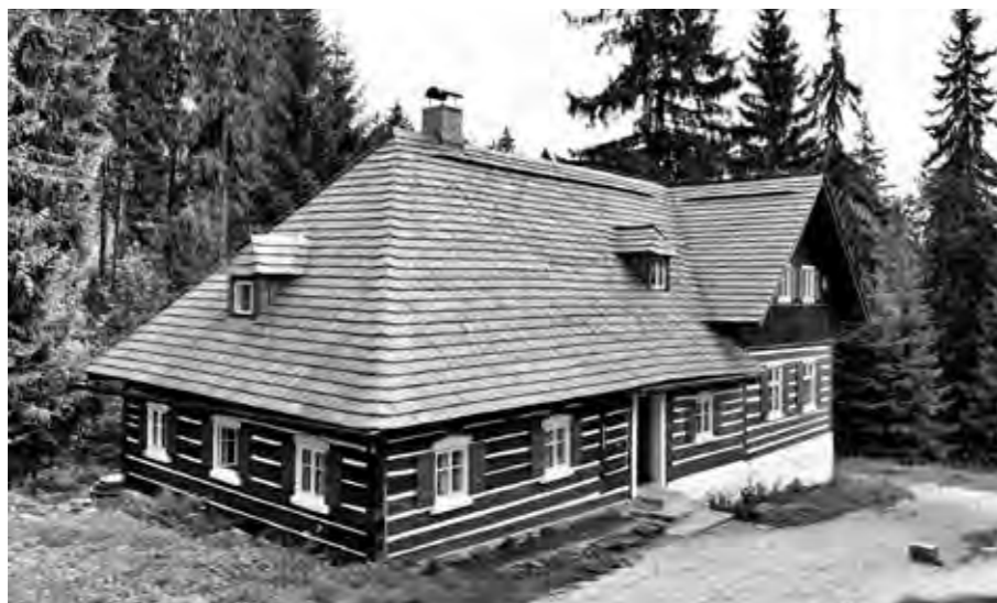
CELKOVÁ OBNOVA PROBÍHALA DLE NÁVRHU JABLONECKÉHO ATELIERU 4 V LETECH 2016 AŽ 2017.