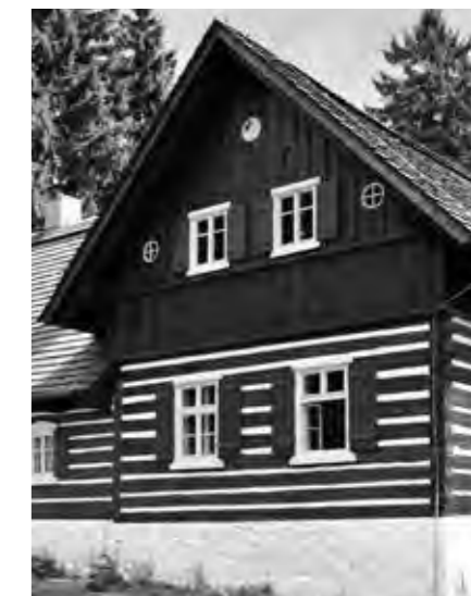
POHLED NA ŠTÍT S ODBORNĚ OŠETŘENOU ROUBENOU KONSTRUKCÍ