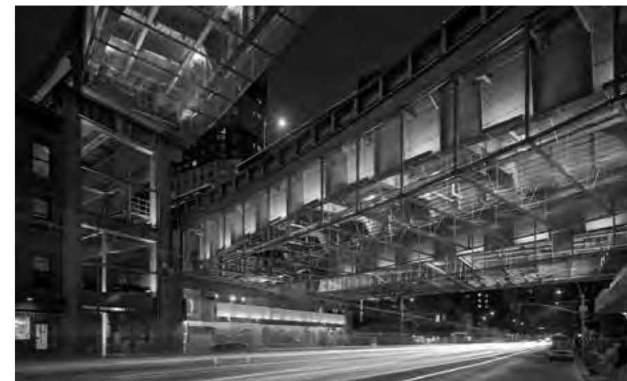
TMAVÝ A NEHOSTINNÝ PROSTOR POD TROJICÍ MOSTŮ TRIPLE BRIDGE GATEWAY BYL OSVĚTLEN PŘEDEVŠÍM S DŮRAZEM NA CHODCE. AUTOBUSOVÝ TERMINÁL PORT AUTHORITY V NEW YORKU

Známa je například pošta v New Yorku: jedná se o monumentální osvětlení, jež reflektuje význam místa a dokáže ho navíc vynést na povrch. Základní myšlenkou je pochopit místo a ukázat jeho význam veřejnosti.