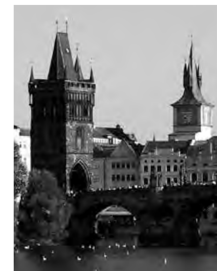
Hlavní město Praha

spektrum zainteresovaných institucí se projevuje na chystaném programu, v rámci přednášek a diskuzních bloků budou diskutovány jak otázky památkové ochrany historických částí měst, tak možné cesty k oživení veřejného prostoru. Svoji účast již přislíbili zástupci dalších měst, která letošní rok slaví stejné výročí, tedy Český Krumlov, Telč a slovenská Banská Štiavnica. Svůj pohled na řešenou problematiku nastíní také samotná organizace UNESCO, která bude mít v programu několik zástupců.