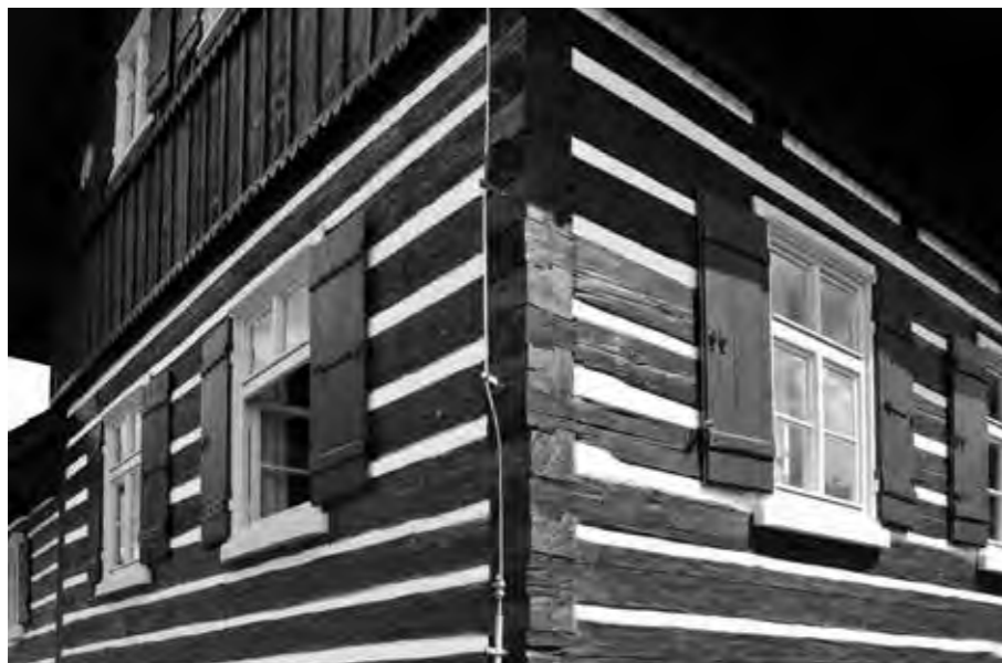
OBNOVA BYLA NOMINOVANÁ V SOUTĚŽI STAVBA ROKU LIBERECKÉHO KRAJE V KATEGORII REKONSTRUKCÍ STAVEB, PAMÁTKOVÝCH OBJEKTŮ A BROWNFIELDS.

ku sklářství s ohledem na historické konstrukce za použití tradičních technologií a materiálů v neposlední řadě svědčí nominace v soutěži Stavba roku Libereckého kraje v kategorii Rekonstrukcí staveb, památkových objektů a brownfields. ■ www.msb-jablonec.cz