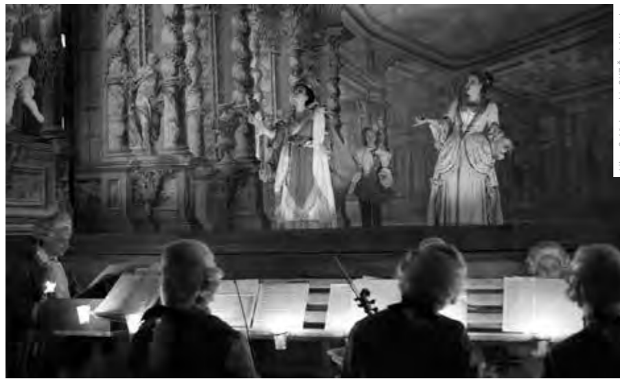
ZÁMECKÉ DIVADLO V ČESKÉM KRUMLOVĚ JE JEDNÍM Z MÁLA NA SVĚTĚ, KDE SE ZACHOVALO PŮVODNÍ VYBAVENÍ, JEVIŠTNÍ TECHNIKA, DEKORACE, KOSTÝMY ČI REKVIZITY.