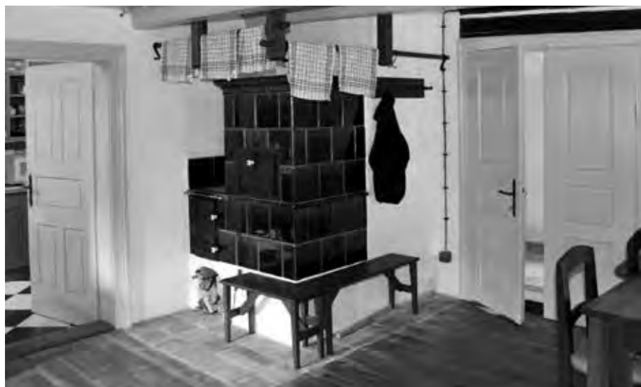
KACHLOVÁ KAMNA V OBNOVENÉ SVĚTNICI V PŘÍZEMÍ

včetně barevných nátěrů roubení byla navrácena na základě stratigrafického průzkumu původní barevnost. Byla osazena kachlová kamna a doplněny nové cihelné dlažby odpovídající původnímu charakteru. Klenutý venkovní prostor bývalého sklepa jižně od domu byl doplněn kamennou zídou se zastřešením nízkou sedlovou střechou v měřítku odpovídajícím střechě dle původní dochované historické fotodokumentace. Touto úpravou vznikla zastřešená terasa pro posezení a občerstvení návštěvníků tvarově asociující původní seník. Neméně podstatným přínosem obnovy je pak vyvrtání nové studny pro zásobování objektu památníku vodou.