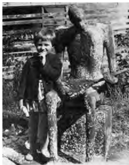
ARCHIVNÍ SNÍMKY MOHOU POSLOUŽIT PŘI RESTAUROVÁNÍ SOCH.