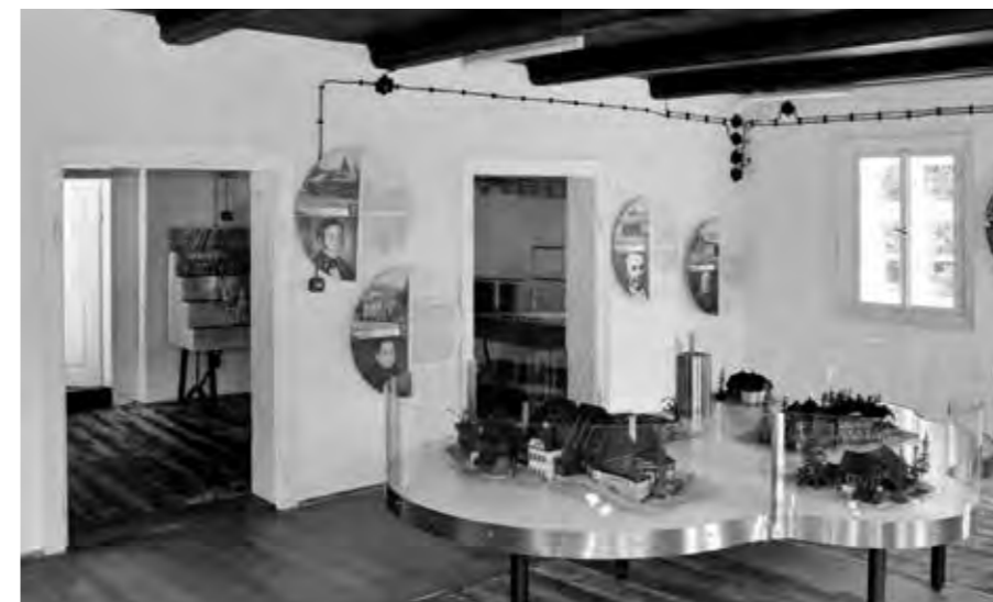
TROJROZMĚRNÝ KOMPLETNĚ RENOVANÝ MODEL OSADY KRISTIÁNOV V DOBĚ NEJVĚTŠÍHO ROZKVĚTU

Veškeré stavební úpravy citlivě provedené rekonstrukce byly předem konzultovány a následně schváleny