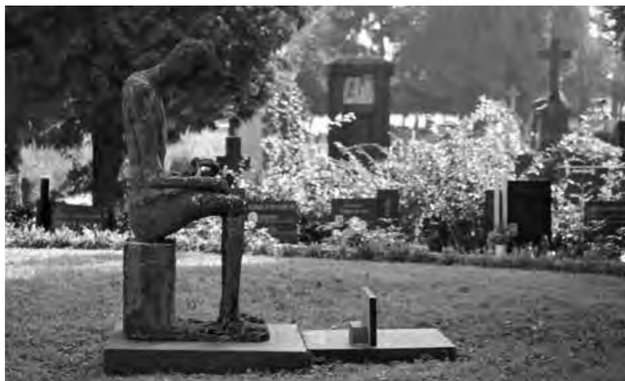
BETONOVÁ SOCHA HUDEBNÍKA Z VSYPOVÉ LOUČKY HŘBITOVA V PŘEROVĚ BYLA DOKUMENTOVÁNA PŘED TRANSFEREM DO RESTAURÁTORSKÉHO ATELIERU.