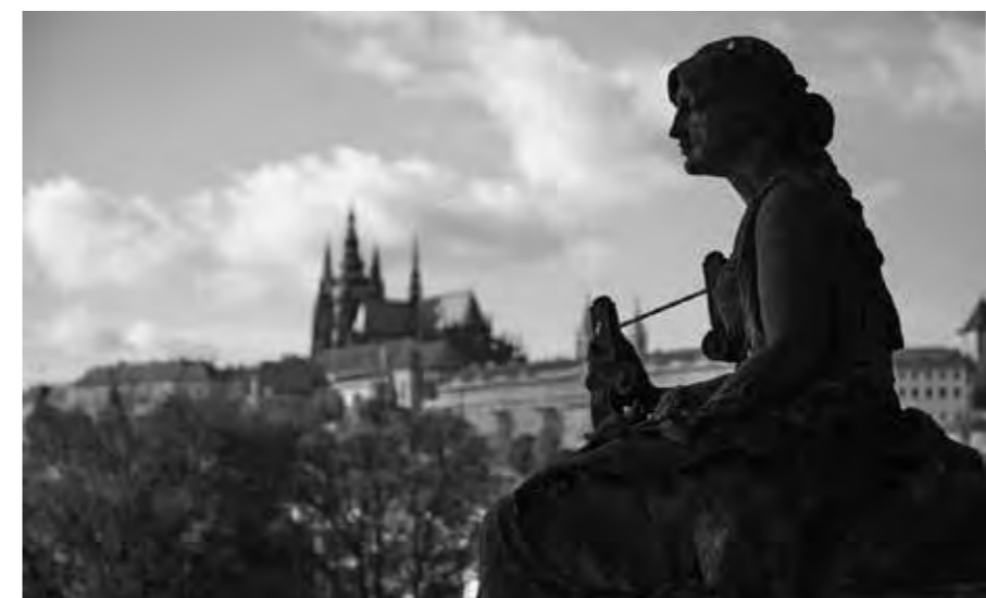
Hlavní město Praha

NA KONFERENCI PRAHA SVĚTOVÁ 2017 ZAVÍTAJÍ ZÁSTUPCI ORGANIZACE UNESCO.