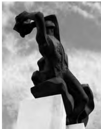
HUDBA Z KOSMU SOCHAŘKY SYLVY LACINOVÉ OSAZENÁ V ROCE 1985 V BRNĚ-KOHOUTOVICÍCH