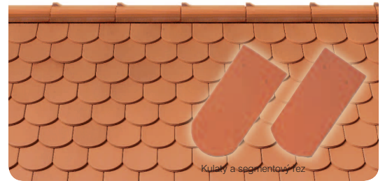
Kulaty a segmentový řez