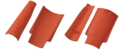
Malý prejz kůrka + háček - líc