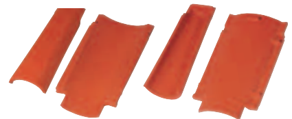
Velký prejz kůrka + háček - líc