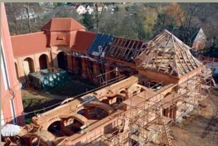
Dostavba východního ambitu – jaro 2020

Závěrečným krokem obnovy je dostavba dle dochované veduty chybějícího východního ambitu – klenutého, zastřešeného ochozu s rohovými kaplemi, zhotoveného z tradičních materiálů a vyzdobeného nástropními malbami, otevřeného arkádami do prostorného dvora přiléhajícího (zrcadlově ke stávajícímu západnímu ambitu) k východní straně kostela. Nový ambit, který měl v barokním době sloužit jako útulek a místo pro průvody a modlitby poutníků přicházejících oslavit svátek P. Marie, doplní chybějící symetrii areálu a stane se novým víceúčelovým společenským prostorem.