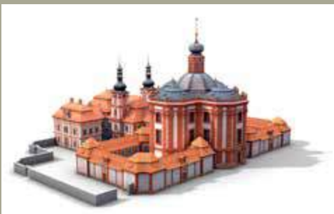
Vizualizace dostavby Mariánské Týnice (Ing. Ivan Klíma)

Záchrana chátrajícího areálu s částečně zříceným kostelem započala okolo r. 1900 a vyvrcholila mezi léty 1989–2019, kdy se Mariánská Týnice znovu zaskvěla ve své původní barokní kráse a začala sloužit jako kulturní centrum přesahující svými aktivitami regionální význam. Celková obnova byla financována z prostředků Plzeňského kraje, Ministerstva kultury ČR, evropského programu IROP a darů institucí a jednotlivců.