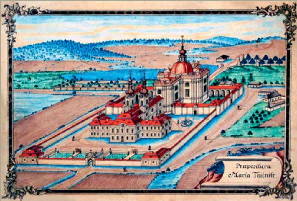
Pozdně barokní veduta Mariánské Týnice (kolem r. 1780) v ideální podobě s oběma ambity