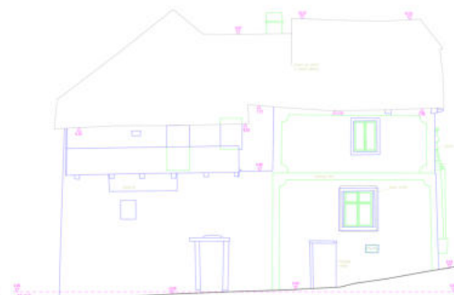
Výkresová dokumentace - půdorys, řez, pohled Areál Feldekova mlýna v Bylanech u Kutné Hory

VÝKRESOVÉ DOKUMENTACE půdorysy, řezy, pohledy v měřítku 1:50