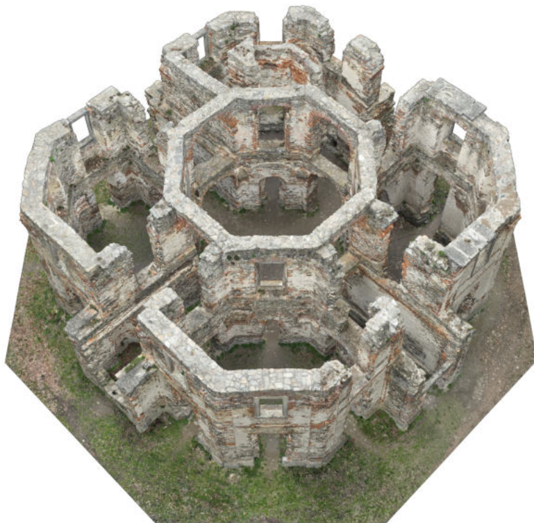
Mračno bodů Zřícenina letohrádku Belveder na Vysoké

Specializujeme se na historické budovy a památky