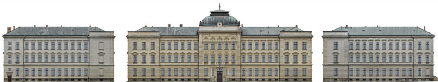
Ortopohedy - ZŠ Žižkov v Kutné Hoře

MRAČNA BODŮ kompletní digitalizace stavby do 3D prostředí