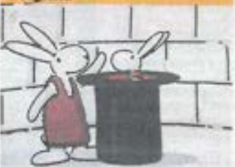
Výstava Vladimíra Jiránka s. 7