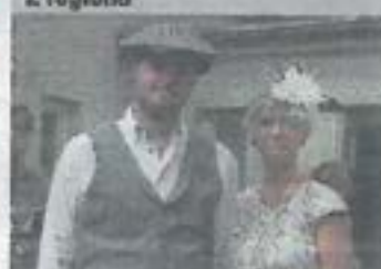
Soutěž veteránů Rataje n. S. s. 6