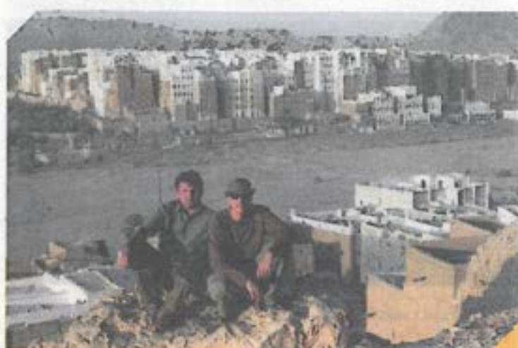
Na reportáži v Jemenu

Když jsem se v roce 1991 přestěhoval do Kolína kvůli výměně bytu, ocitl jsem se ve městě, které jsem vůbec neznal. Dokonce jsem ani nevěděl, jak se jmenuje kolínská katedrála. To mi vadilo, a tak