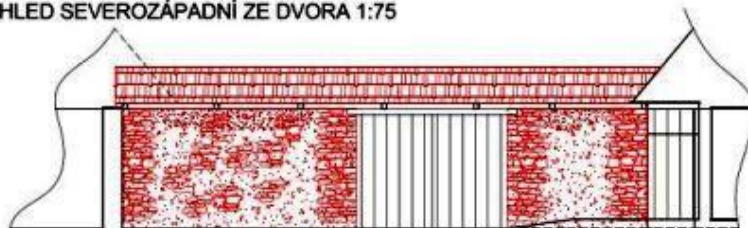
Kozlov, bývalá rychta – kulturní památka, projekt opravy zdi - výkresová dokumentace