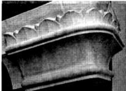
SÁDROVÝ, RUČNĚ VYROBĚNÝ MODEL KACHLE pro repliku kamen, ze kterých se zachovala jen jedna oprýskaná kachle a mělo, tole stěnová.

Umění, třeba obraz, obohacuje člověka na duchovní stránce, ale sám o sobě nic nepřináší. Totéž hudba, je krásná, člověka povznese, ale jakmile domí, nic z ní není. Tady, v našem řemesle, se