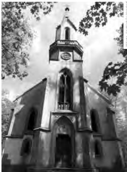
Město Jindřichův Hradec