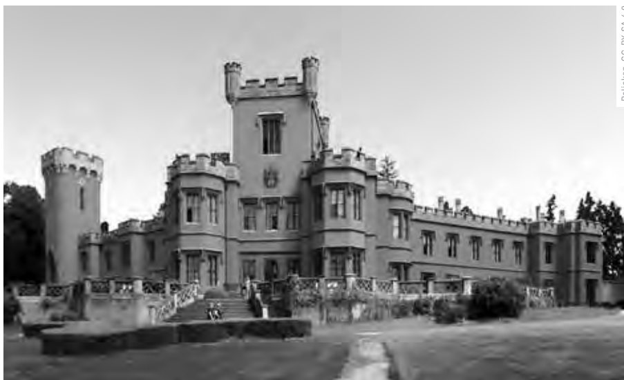
Patricep, CC-BY-SA 4.0

NOVOGOTICKÝ ZÁMEK HRÁDEK U NECHANIC LÁKAL JAROSLAVA PLESLA K VÝLETŮM NA KOLE UŽ V DĚTSTVÍ, POZDĚJI SE STAL TAMNÍM PRŮVODCEM.