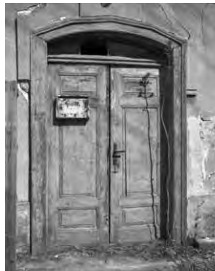
VSTUP DO DOMU ČP. 16 V ČERNÍKOVÍCÍCH, 2017