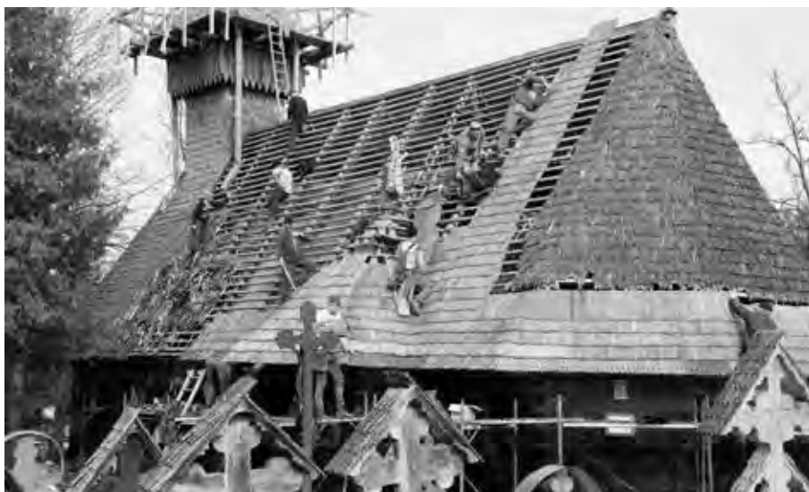
V RÁMCI RUMUNSKÉHO PROJEKTU ZÁCHRANKA PRO PAMÁTKY BYLY BĚHEM PĚTI LET OBNOVENY STOVKY OBJEKTŮ, ZVLÁŠTĚ DŘEVĚNÝCH PRAVOSLAVNÝCH KOSTELŮ.