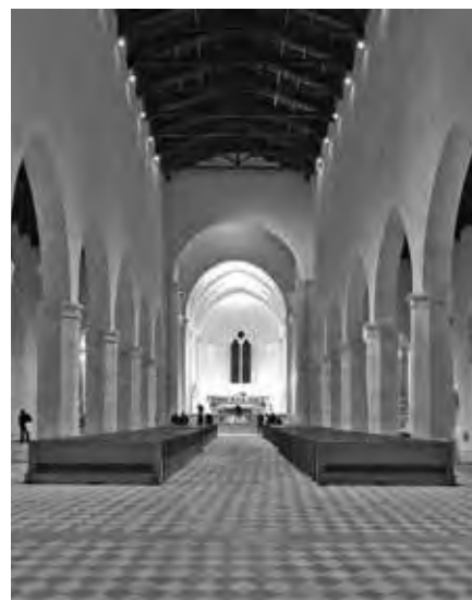
BAZILIKA SANTA MARIA DI COLLEMAGGIO V L'AQUILE VE STŘEDNÍ ITÁLII