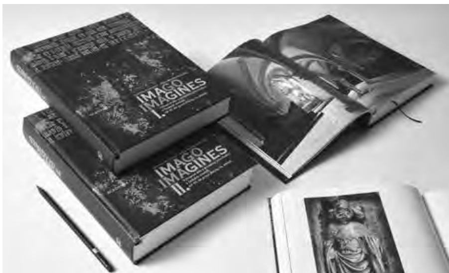
NA SVĚ SI PŘIJDOU NEJEN MILOVNÍCI STŘEDOVĚKÉHO UMĚNÍ, ALE I OBDIVOVATELÉ KVALITNÍCH FOTOGRAFIÍ.