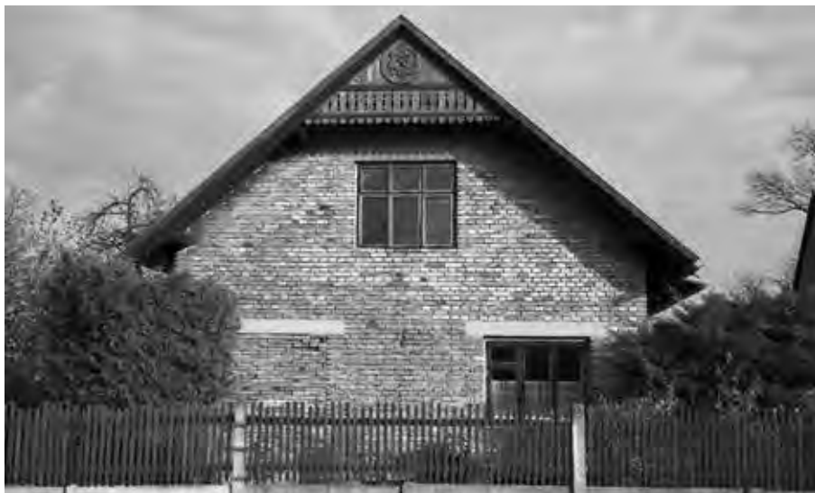
ZÁPADNÍ PRŮČELÍ DOMU ČP. 115 V JASENNÉ, 2017