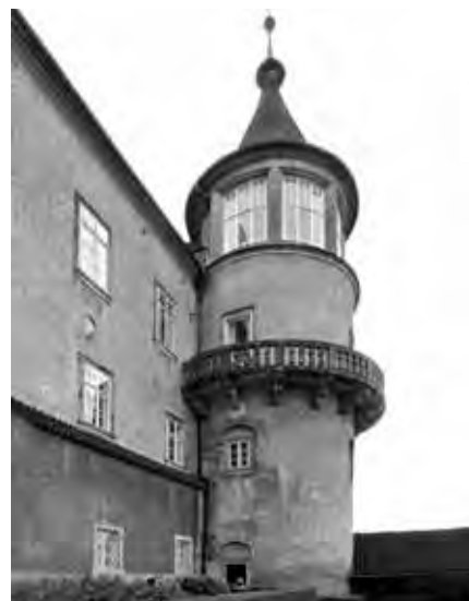
Ewwwa, CC-BY-SA 3.0

NOVOGOTICKÝ ZÁMEK HRÁDEK U NECHANIC LÁKAL JAROSLAVA PLESLA K VÝLETŮM NA KOLE UŽ V DĚTSTVÍ, POZDĚJI SE STAL TAMNÍM PRŮVODCEM.