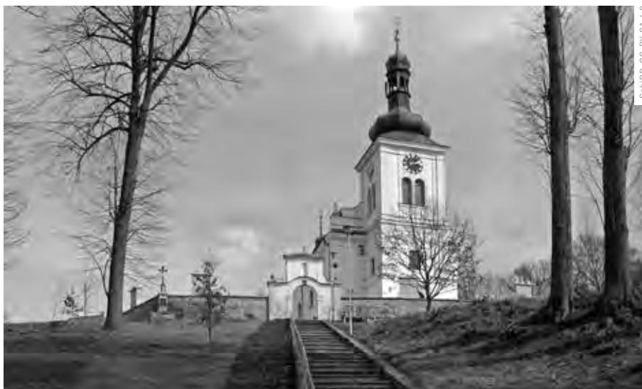
Schidd, CC-BY-SA 4.0

Z PROGRAMU MINISTERSTVA ZEMĚDĚLSTVÍ BYLA PODPOŘENA OBNOVA KŘÍŽOVÉ CESTY V AREÁLU KOSTELA SV. MARTINA V MARKVARTICÍCH.