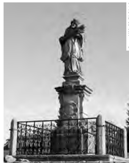
RomanM82, CC-BY-SA 4.0

Z PROGRAMU MINISTERSTVA ZEMĚDĚLSTVÍ BYLA PODPOŘENA OBNOVA KŘÍŽOVÉ CESTY V AREÁLU KOSTELA SV. MARTINA V MARKVARTICÍCH.