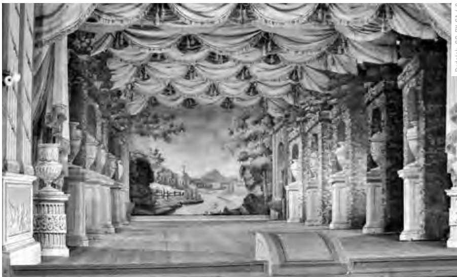
Pudélek, CC-BY-SA 4.0

JAKO STŘEDOŠKOLÁK MĚL PŘÍLEŽITOST ZAHRÁT SI V BOCCACCIOVĚ DEKAMERONU V BAROKNÍM DIVADLE V LITOMÝŠLI, KTERÉ ZŘÍDIL HRABĚ VALDŠTEJN-VARTEMBERK ROKU 1797.