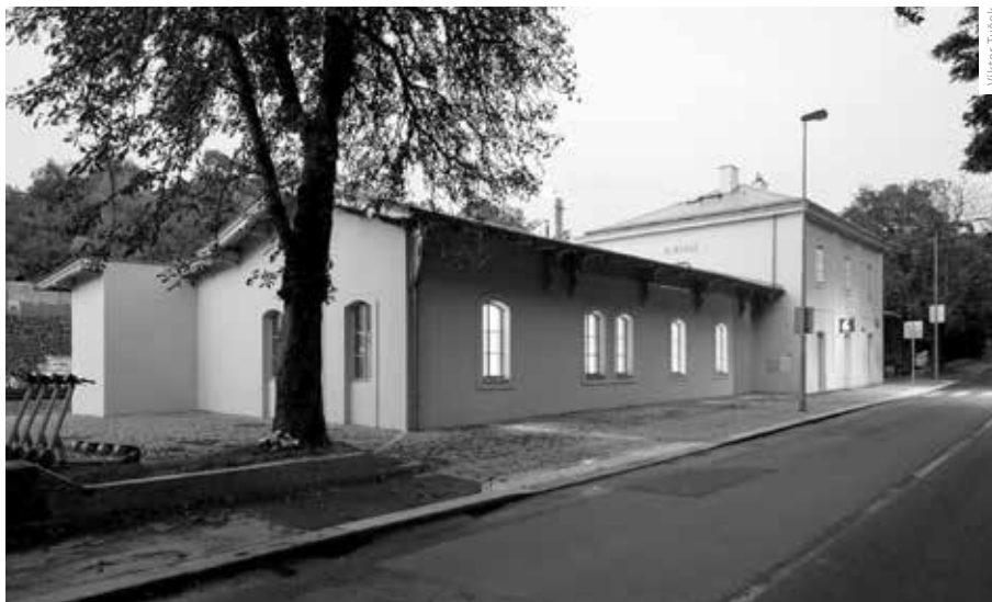
BÝVALÉ BUBENEČSKÉ NÁDRAŽÍ PŘI POHLEDU Z ULICE