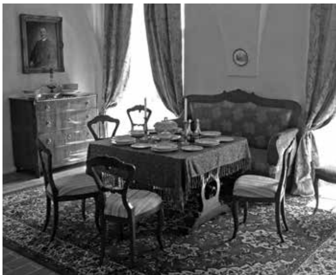
PRVNÍ PROHLÍDKOVÁ TRASA ZÁMKU VARTENBERK, PANSKÁ JÍDELNA V DOBĚ BIEDERMEIERU