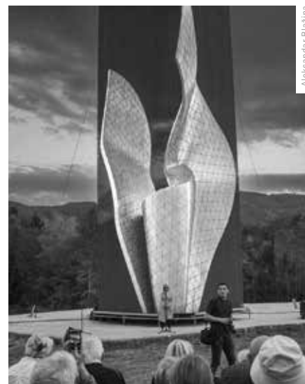
MULTIMEDIÁLNÍ INSTALACE SPOMENIKU V CHORVATSKÉ VESNICI KAMENSKA