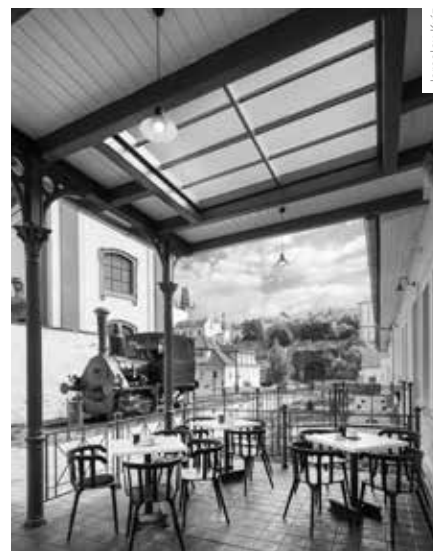
PROSTOR BÝVALÉHO PERONU LITOMĚŘICKÉHO NÁDRAŽÍ