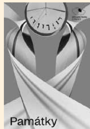
Národní památkový ústav

KRÁLOVÉHRADECKÝ A PARDUBICKÝ KRAJ | Odborný časopis Památky, který vydává Národní památkový ústav, se v dalším vydání zaměřuje na nové poznatky v oblasti obnovy památek v Královéhradeckém a Pardubickém kraji. Upozorňuje i na neobjevené památky a popularizaci oboru.