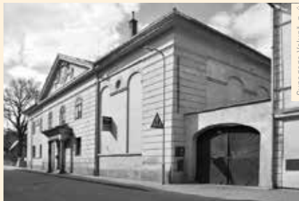
Synagoga Volyně, z. ul.

chrana a zpřístupnění cenné památky, která se dlouho nacházela v neutěšeném technickém stavu. Na podrobnosti obnovy, využití místa pro kulturní účel a další aktivity jsme se zeptali jeho zakladatelky.