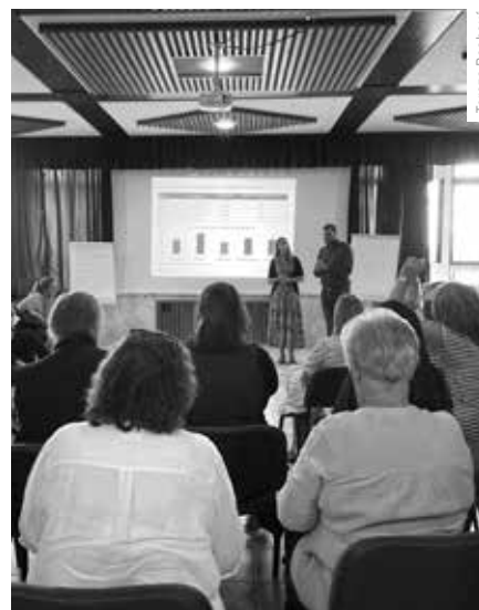
Z WORKSHOPU V MIKULOVĚ VĚNOVANÉHO STRATEGII KULTURY A CESTOVNÍHO RUCHU

Udržitelnost zahrnuje environmentální ohleduplnost, ekonomickou životaschopnost a sociální přínos pro společnost. Například u projektů financovaných z norských fondů byl právě požadavek norských donorů na zpracování strategie, aby byly projekty záchrany památek a revitalizace kulturního dědictví dlouhodobě udržitelné, aby měly nastavený finanční plán i po době udržitelnosti, aby se realizátoři zamysleli, jak budou financovat provoz a koho mohou zapojit do spolupráce. Často propojujeme kulturní aktéry s destinačními organizacemi rozvíjejícími cestovní ruch v oblasti, protože si mohou být vzájemně velmi prospěšní a často o sobě ani neví. Udržitelnost tedy není jen otázkou financí,