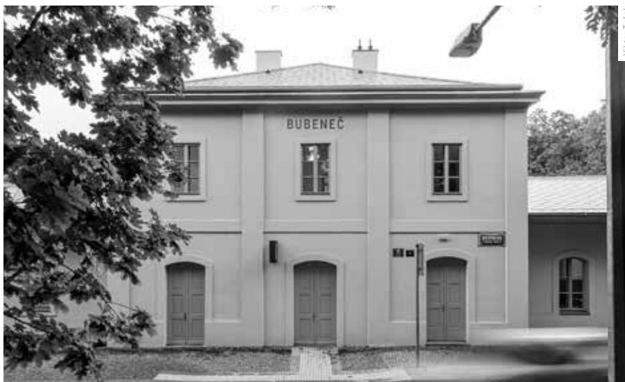
STŘEDNÍ ČÁST BUDOVY S NOVĚ POJEDNANÝM NÁPÍSEM BUBENEČ

prakticky limitováni ani dohledem památkové péče.