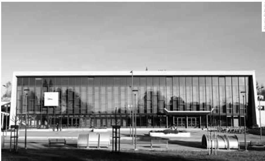
HLAVNÍ PROSKLENÉ PRŮČELÍ PO OBNOVĚ