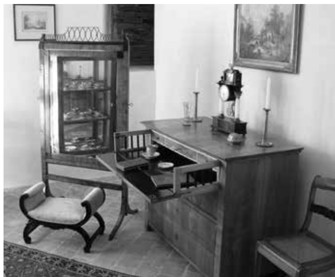
PRVNÍ PROHLÍDKOVÁ TRASA ZÁMKU VARTENBERK, DÁMSKÝ POKOJ – BUDOÁR

sbírek muzejní povahy Ministerstva kultury ČR.