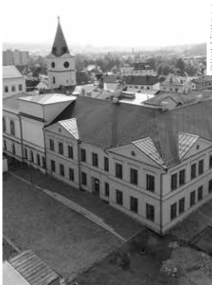
Chládek & Tintěra, a. s.