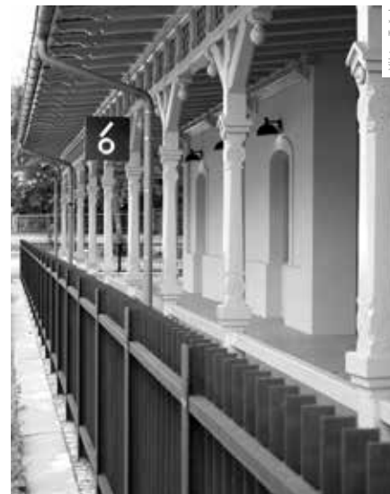
CORTENOVÝ PLECH ODDĚLUJÍCÍ KOLEJIŠTĚ OD DŘEVĚNÉ VERANDY