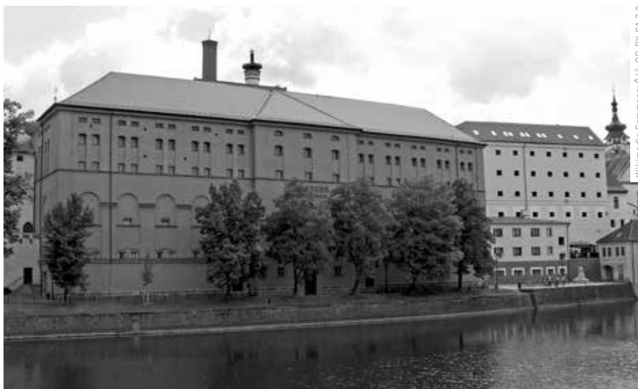
ODBOŘNÍCI Z KREIA GROUP AKTUÁLNĚ POMÁHAJÍ TVOŘIT NOVOU STRATEGII VE SLADOVNĚ V PÍSKU, KTERÁ KAŽDOROČNĚ PŘILÁKÁ 60 TISÍC NÁVŠTĚVNÍKŮ, PŘEVÁŽNĚ RODIN A DĚTÍ.

novat obyvatele do jejich realizace. Důležité je ukázat, že kultura není jen opera, ale je to i obyčejné setkávání a sdílení, společný program v obci nebo veřejná knihovna a že má přidanou hodnotu pro každodenní život. Mimo jiné je skvělým příkladem obec Poniklá v Krkonoších, kde žije asi jen 1 000 obyvatel, ale fungují tam desítky spolků. Většinou to začíná několika aktivními jedinci, kteří na sebe postupně nabalují další skupiny. Není ale špatně, když to iniciuje samospráva.