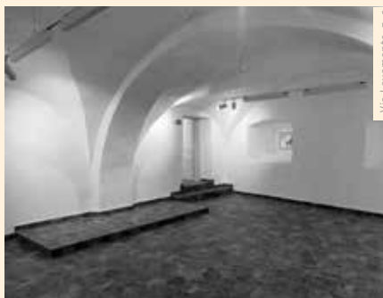
Via Levamente, z. s. j.

PĚTIPSY (CHOMUTOVSKO) | Nedávno byla dokončena další významná fáze náročné záchranu a obnovy architektonicky a urbanisticky cenného zá-