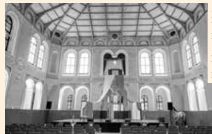
Národní památkový ústav

PRAHA | Na Nové scéně Národního divadla byly 15. listopadu vyhlášeny Ceny Národního památkového ústavu Patrimonium pro futuro 2024. Vítězové obdrželi skleněné sošky symbolizující pomocnou ruku památkové péče od sochaře Kurta Gebauera, které vznikly ve firmě Lasvit.