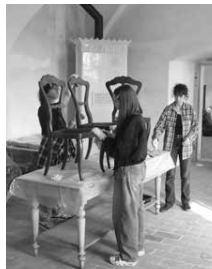
INSTALACE HISTORICKÉHO MOBILIÁŘE NA ZÁMKU VARTENBERK