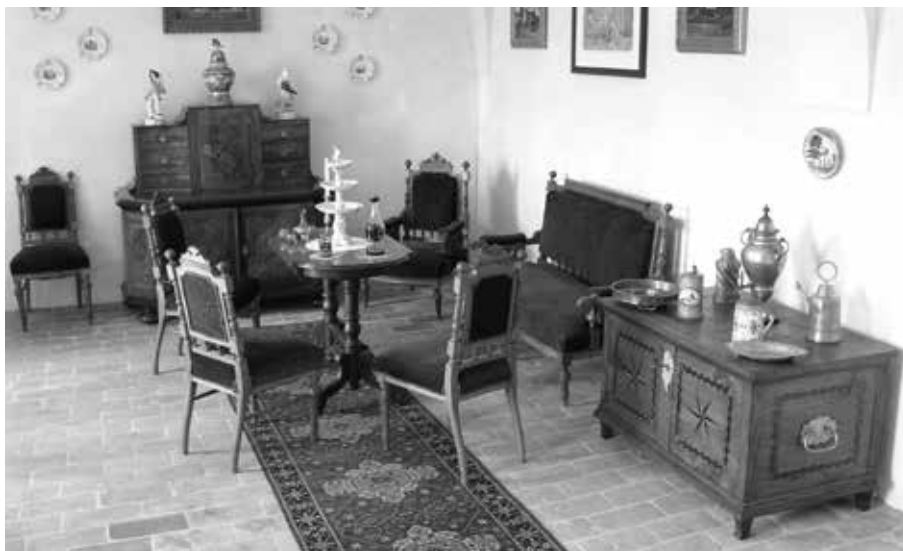
PRVNÍ PROHLÍDKOVÁ TRASA ZÁMKU VARTENBERK, HARTIGOVSKÝ SALON S MOBILIÁŘEM Z 18. A 19. STOLETÍ