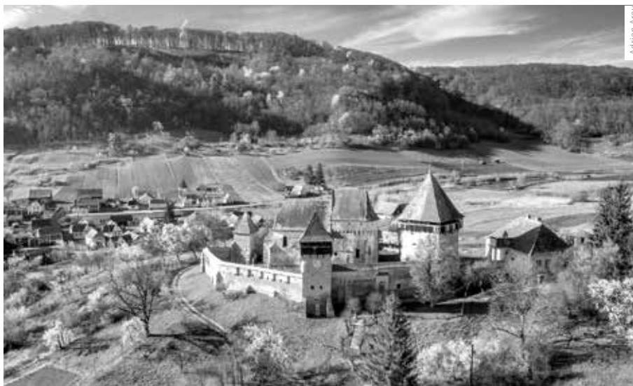
LUTERÁNSKÝ KOSTEL V SASKÉ VESNICI ALMA VII V RUMUNSKU