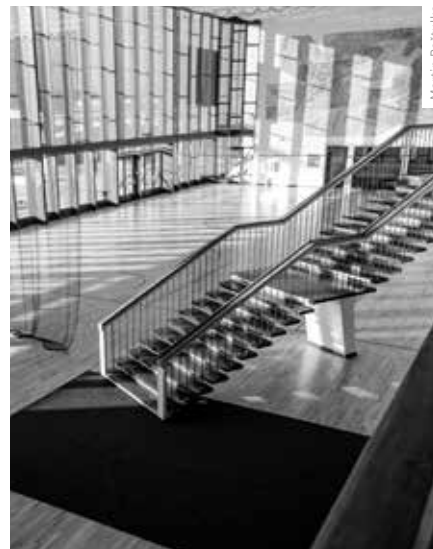
CHARAKTERISTICKÉ INTERIÉROVÉ SCHODIŠTĚ

Zhotovitelem se stala společnost OHLA ŽS, a. s. Celkové náklady prací činily 167,4 milionu korun. Akce se stala Železniční stavbou roku 2021, dále získala mimo jiné ocenění v I. a IV. kategorii v soutěži Stavba Moravskoslezského kraje 2022. ■