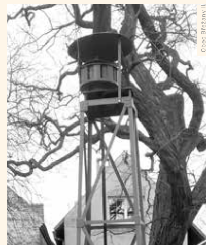
Obec Břežany II

Ve třetím čtvrtletí roku 2024 přibýlo do evidence Národního památkového ústavu 12 nemovitých kulturních památek. Ministerstvo kultury za ně prohlásilo mimo jiné brněnský areál bývalé textilní továrny Mosilana, Robertovu vilu v Židlochovicích, venkovskou usedlost v Borovnici a kulturní dům s Památníkem Emila Holuba v Holicích. Památkami se staly městské domy v Manětíně a Počepicích nebo hasičská stožárová rotační siréna v Břežanech II.