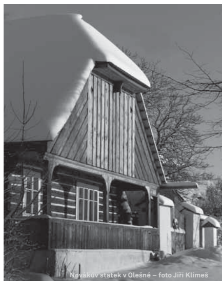
Novákov státek v Olešné