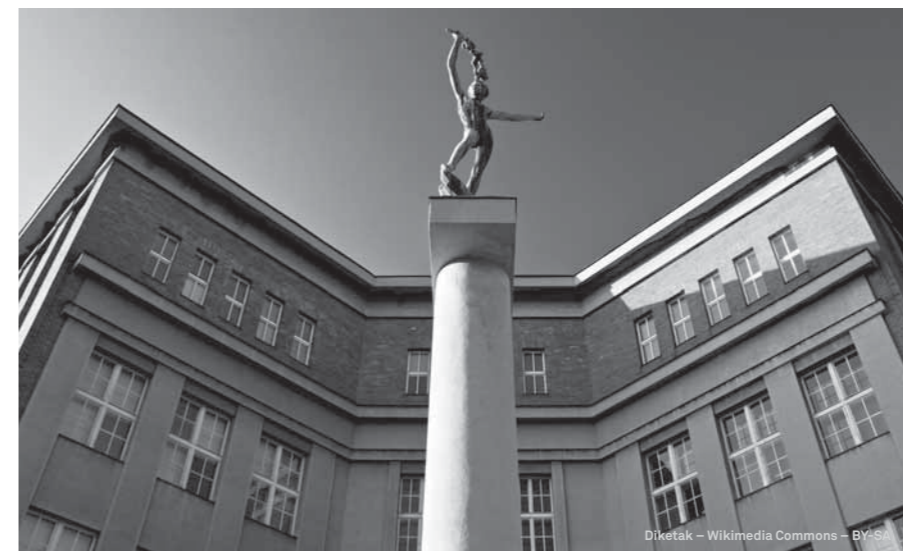
VÍTĚZNÝ SNÍMEK: GYMNÁZIUM J. K. TYLA V HRADCI KRÁLOVÉ.