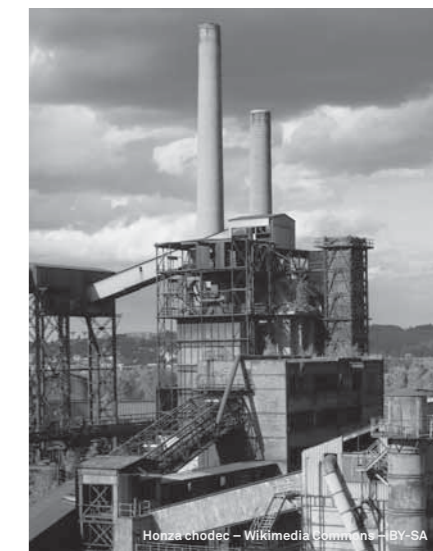
2. MÍSTO: DOLNÍ OBLAST VÍTKOVICE.