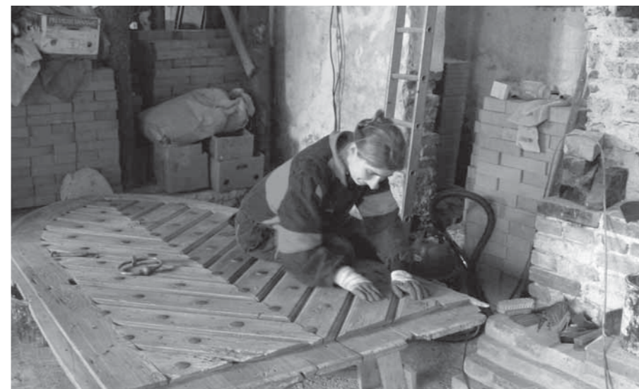
MAJITELÉ KOSTELA SE NA OPRAVÁCH SVÉHO DOMOVA TAKÉ SAMI PODÍLÍ.

TEXT – MARKÉTA LAJDOVÁ