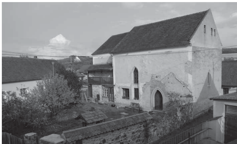
POHLED NA ZAHRADU KOSTELODOMU S PAVLAČÍ A OBNOVENÝM GOTICKÝM PORTÁLEM.