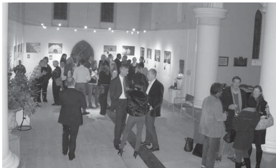
VERNISÁŽ VÝSTAVY V KOSTELE SV. JANA V MĚSTSKÉ ČÁSTI NOTTING HILL.