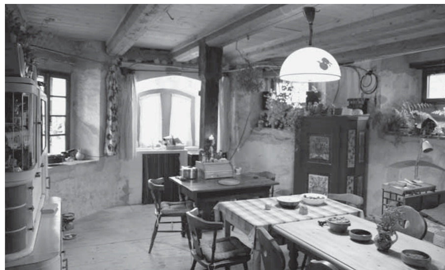
POHLED DO KUCHYNĚ UMÍSTĚNÉ V PROSTORU BÝVALÉHO KNĚŽIŠTĚ.

dokončené, je jasné, že popsaný plán minimalizace zásahů do původní stavby se při rekonstrukci precizně dodržoval. Bydlení má venkovský charakter, avšak skýtá jistou míru komfortu, za nějž majitelé považují hlavně teplou vodu a splachovací záchod. Koupelna je umístěná v sakristii, která svým původním účelem nejvíce umožňuje instalaci nutného zázemí. V kněžišti je kuchyně, jídlo se připravuje na stole, který je na místě hlavního oltáře. Vaří se za „oltářem“, tedy na sporáku v okenním výklenku. V patře kněžiště je ložnice. V přízemí lodi je „anglická pracovna“ spojená schodištěm s letním obývacím pokojem. Západní polovina lodi zůstává neobydlená – v přízemí je uskladněno dřevo a stavební materiál, v patře je lešení podepírající klenbu.