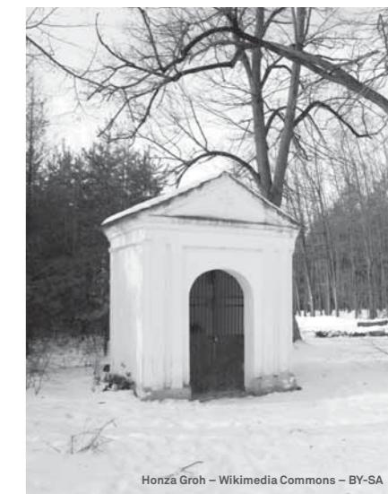
Honza Groh – Wikimedia Commons – BY-SA