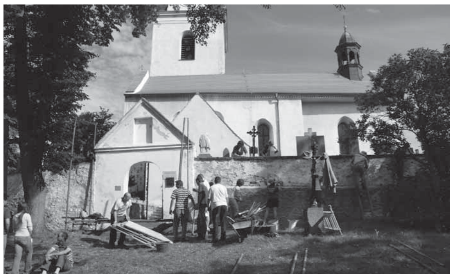
INSTITUT PRO PAMÁTKY A KULTURU ORGANIZOVAL TAKÉ MEZINÁRODNÍ DOBROVOLNICKÉ KEMPY.