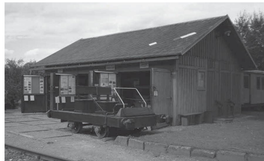
EXPOZICE HISTORICKÝCH DREZÍN V ZUBRNICKÉM MUZEU.

Jsou nám blízké i jiné železniční památky mimo naši lokálku. To je osud i vodárny Střekov z roku 1874 s parním strojem. V celostátním měřítku unikátně dochovaná stavba záhadně přežila polistopadové poměry a dochovaný interiér byl objeven jen náhodou. Původně jsme chtěli stavbu zabezpečit a předat ji někomu, kdo se stará o industriální památky, ale záhy jsme zjistili, že nikdo takový tady prostě není, a tak klíče od vodárny nám stále zůstávaly v kapse. Snahy do projektu zatáhnout