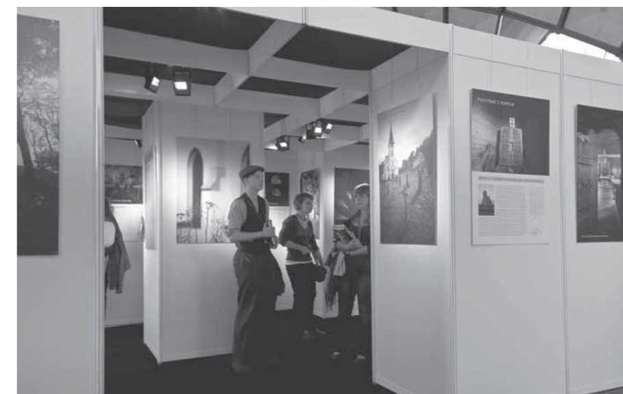
SOUČÁSTÍ DOPROVDNÉHO PROGRAMU VELETRHU BYLY TAKÉ VÝSTAVY.

Vedle odborných firem se prezentovala řada neziskových organizací, které měly zvýhodněné podmínky pro své stánky. Mezi nimi byl i portál PROPAMÁTKY, který takřkajíc „vystoupil z monitoru ven“. Jeho redaktoři všem zájemcům vysvětlili poslání a smysl tohoto projektu, který se snaží zastřešovat informace o obnově a využívání památek. ■