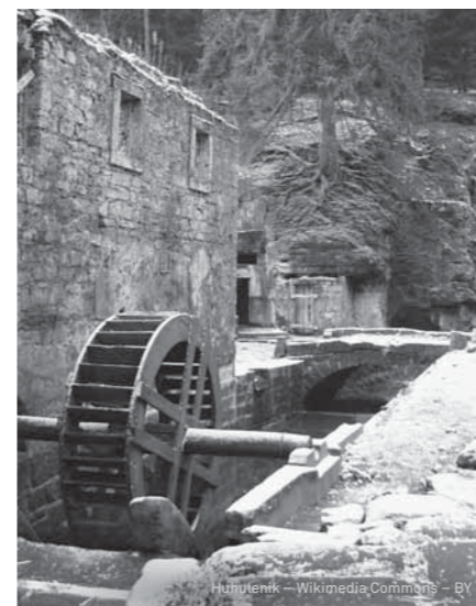
Hutuleň – Wikimedia Commons – BY