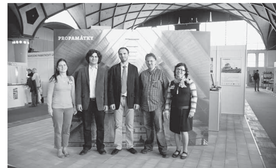
ČÁST TÝMU REDAKTORŮ PORTÁLU PROPAMÁTKY U SVÉHO VELETRŽNÍHO STÁNKU.