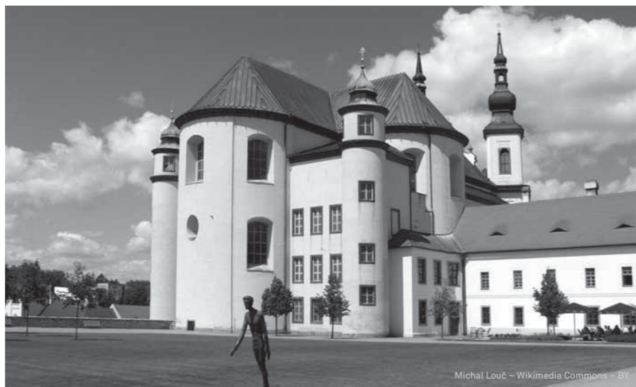
Michal Louč – Wikimedia Commons – BY

Na portálu PROPAMÁTKY Vás v sekci Financování pravidelně informujeme o aktuálně vyhlášených programech na záchranu a obnovu památek. Tato oblast bývá obvykle financována ze šesti hlavních zdrojů: stát, kraje, města, mezinárodní fondy, nadace a nadační fondy a také veřejné sbírky. V tomto čísle čtvrtletníku se zaměříme na krajské dotace.